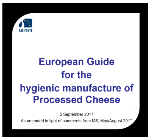
Europejski Przewodnik higieny produkcji sera topionego

Na wczorajszym Komitecie Zarządzającym of DG Sante, zostały zaprezentowane dwa projekty przemysłowych przewodników dotyczących serów w ich niemal finalnej wersji: przewodnik EDA-Eucolait dot. sera jako surowca oraz przewodnik Assifonte higieny w dobrej praktyce produkcyjnej serów topionych. Na początku lata, kraje członkowskie wniosły 110 uwag, które były kierowane dla przez przemysłowych ekspertów. Komisja zaprezentowała zrewidowane wersje krajom członkowskim, które je popierały. Finalny projekt będzie rozesłany w następnym tygodniu do Krajów Członkowskich w celu ostatecznej aprobaty na ich następnym spotkaniu.