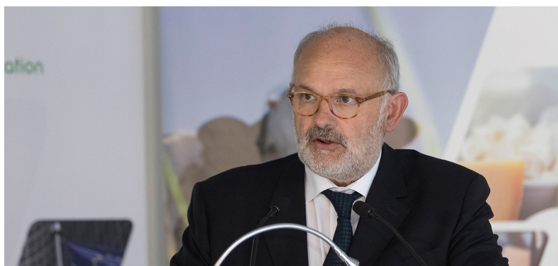
Przewodniczący EDA Michel Nalet

„ Wzmacnianie elementów środowiskowych, opcje dla podejść bardziej nakierowanych na poziomie krajowym, generacyjne odnowienie oraz ustanowienie platformy zarządzania ryzykiem są najbardziej potrzebnymi elementami przyszłej CAP. W odniesieniu do Wspólnej Organizacji Rynku , https://eur-lex.europa.eu/legal-content/EN/TXT/PDF/?uri=CELEX:32013R1308&from=EN , bazowe cechy siatki bezpieczeństwa nie są zmienione. Limity budżetowe dot. Schematu Mleka w Szkole będą na pewno tematem dyskusji w ramach dalszego procesu.